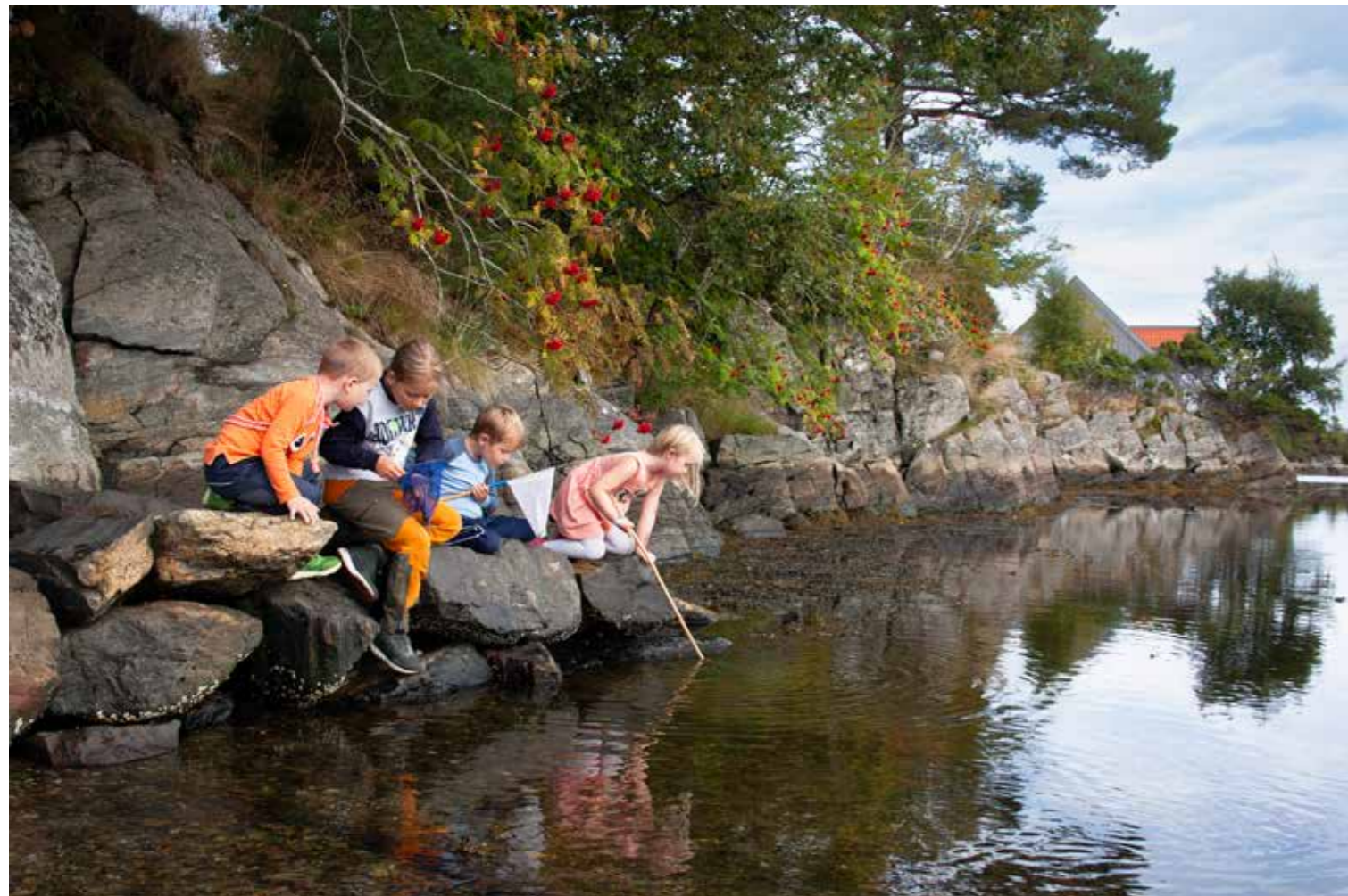
Ungar i fjæra på Kystmuseet i Sogn og Fjordane.