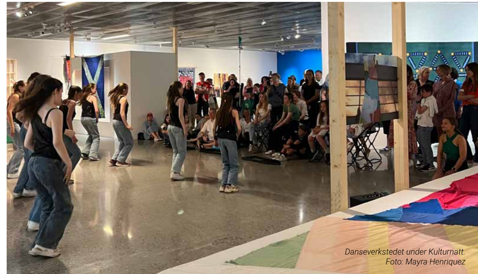
Danseverkstedet under Kulturnatt.

Kunstmuseet har hatt månedlege verkstadtilbod for barn, med opplegg knytte til både utstillingar