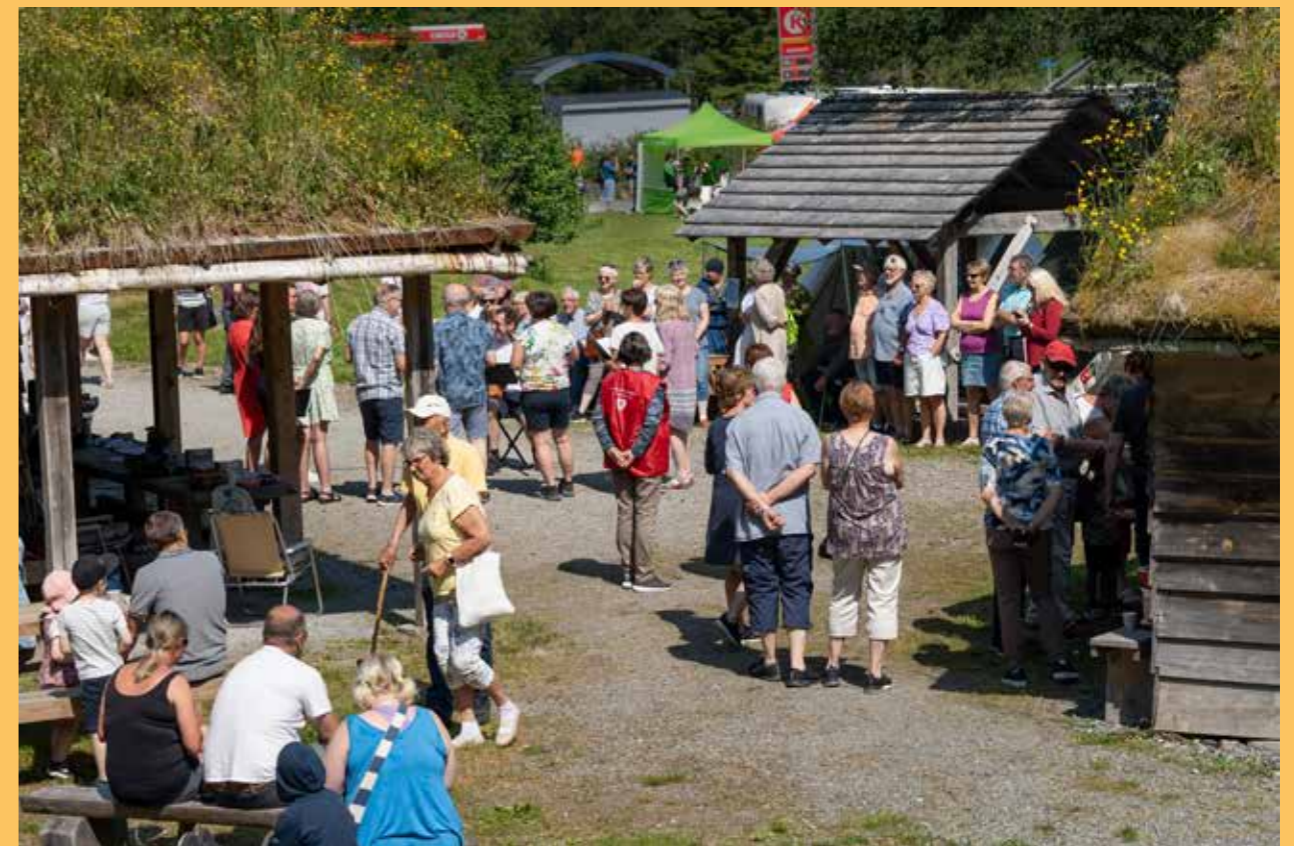
Kvernsteinsmarknaden i Hyllestad drog mange gjester.

Vi nyttar felles rapporteringsskjema for besøkjande, med utgangspunkt i føringane om publikumsregistrering frå museumsseksjonen i Norsk Kulturråd. Besøkjande som berre nyttar musea sine kafétilbod og friluftsområde til rekreasjon, er ikkje registrert i besøksstatistikken