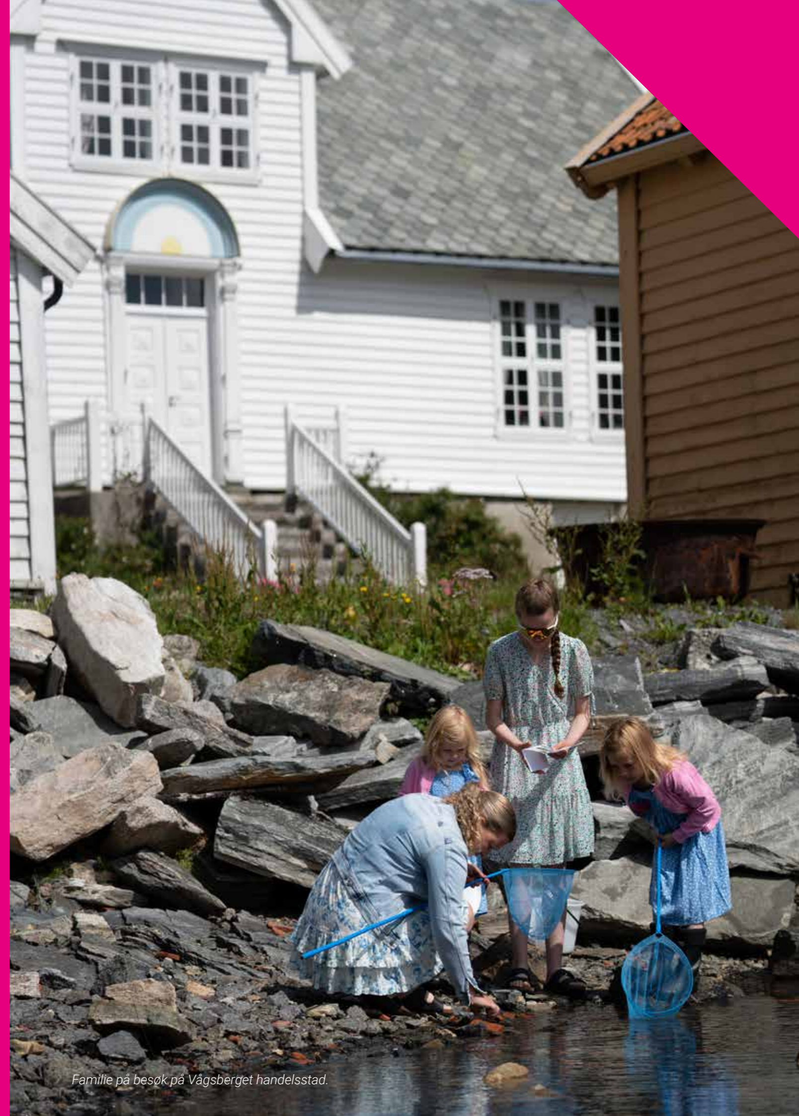
Familie på besøk på Vågsberget handelsstad.