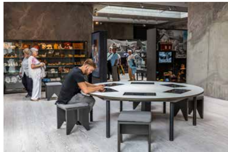
Besøkande ved Norsk Reiselivsmuseum i Balestrand.

Dei fleste musea freistar å programmere arrangement og aktivitetar som gjev meningsfulle opplevingar til heile familien. Døme på dette er tema- og familiedagar, feriedagar, sommarskule, m.m. Særskilt tilrettelagde formidlingstilbod Fleire av musea våre tilbyr skreddarsydde opplegg for besøksgrupper med ulike behov for tilrettelegging, og ofte er desse tilboda resultatet av godt samarbeid og dialog med lokale aktørar. I 2023 har musea bidrege til gode og meningsfulle opplevingar for menneske med demens, brukarar av dagtilbod ved omsorgssenter, høgskulestudentar, tilsette i SFO med fleire.