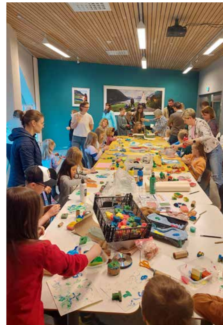
Familieverkstad med trykking.

og relevante tema for årstidene. Tilbodet er svært populært og er ein del av Musea i Sogn og Fjordane sitt mål om meir tilrettelegging for publikumsgrupper som har tid til museumsbesøk i helgene. I adventstida gjennomførte vi verkstader både på Eikaasgalleriet og kunstmuseet.