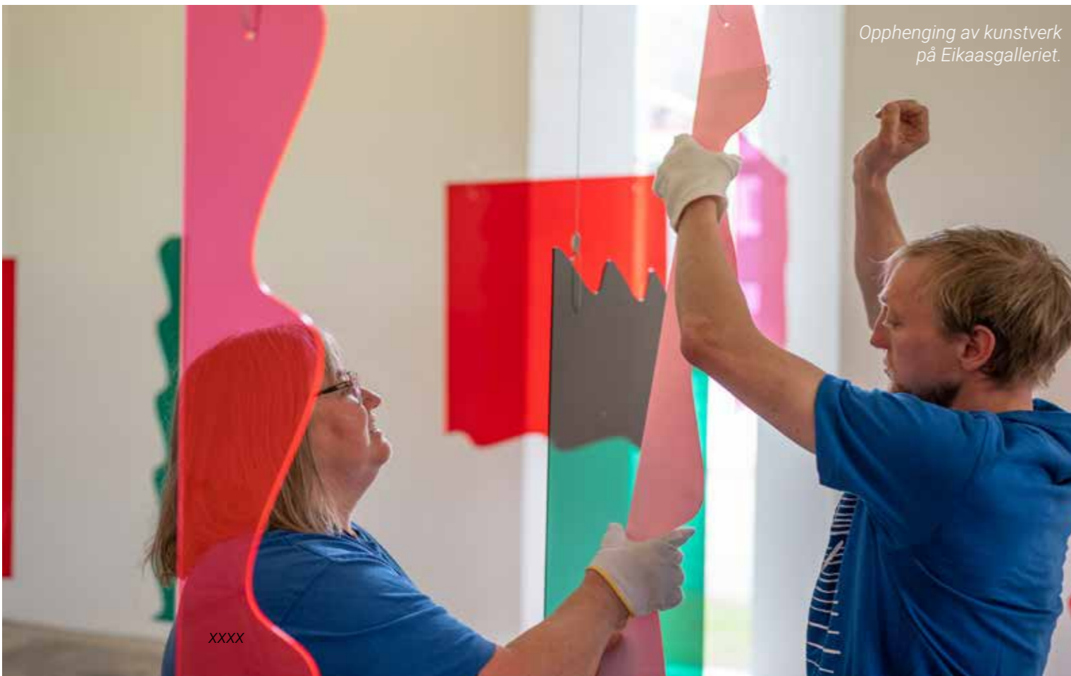
Opphenging av kunstverk på Eikaasgalleriet.