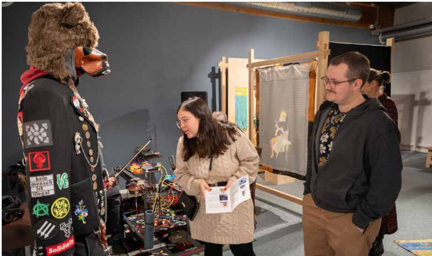
Publikum besøker utstillinga «Skakke folkedrakter» på Sunnfjord museum.

Dyr – daude og levande – var tema for utstillinga «Dyrebar» på Nordfjord Folkemuseum og den fotodokumentariske vandretstillinga «Livreddaren» på Sunnfjord Museum. Utstillingane formidla korleis heile dyret blei nytta for å skaffe mat, sko, klede, reiskapar og andre ting, og vidare korleis denne ressursutnyttinga har endra seg, og om kunnskap som er i ferd med å forsvinne.