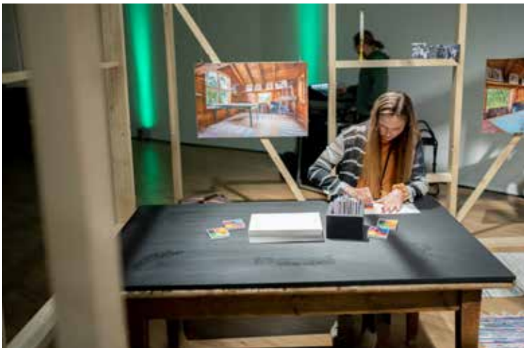
Inne i reisverk-modellen av Astrup sitt atelier.