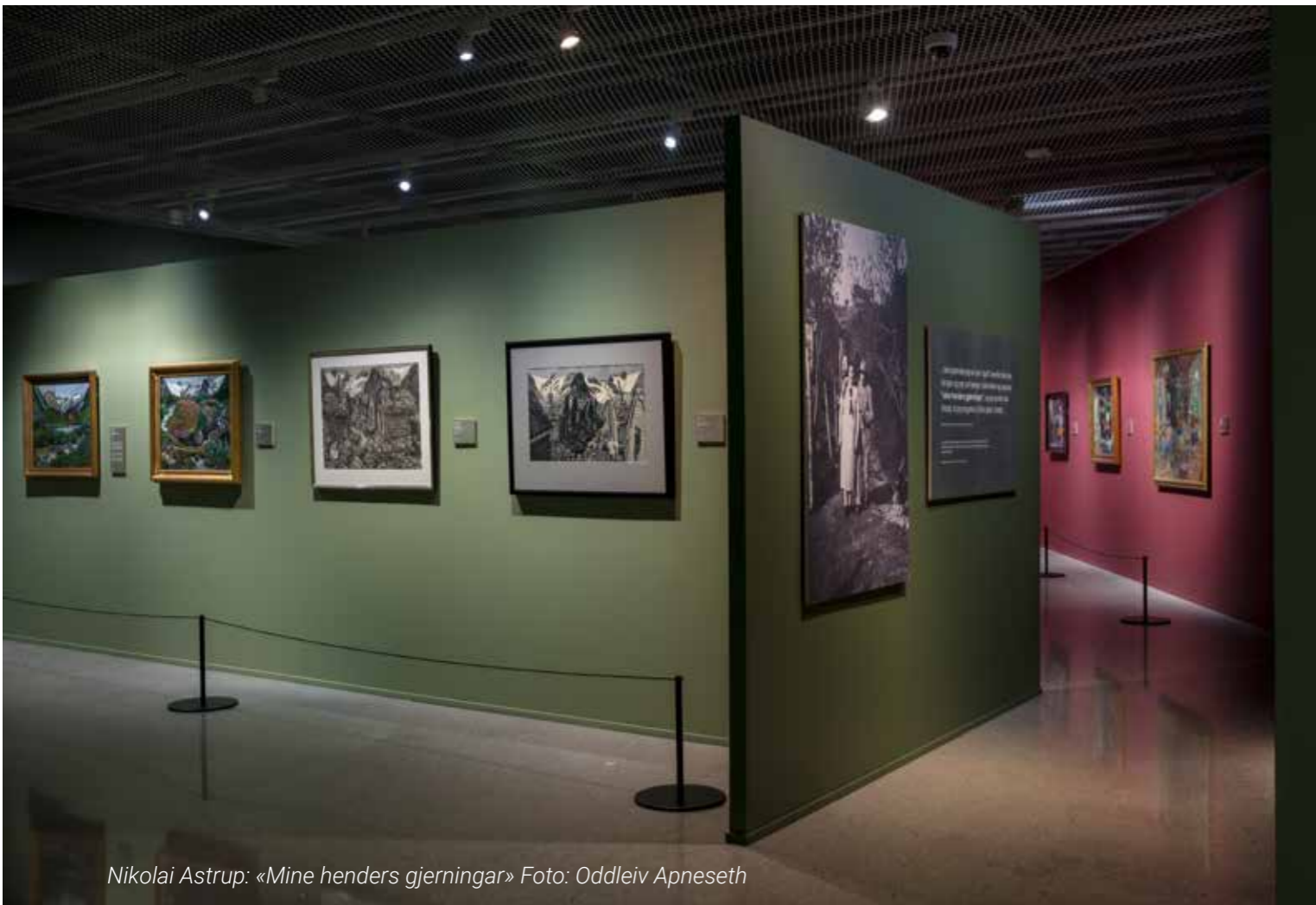
Nikolai Astrup: «Mine henders gjerningar» Foto: Oddleiv Apneseth