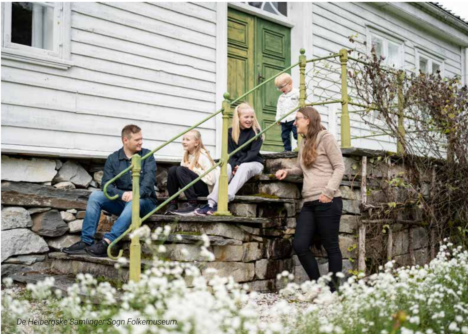
De Heibergske Samlinger Sogn Folkemuseum.