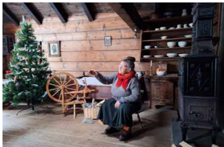
Jul på Nordfjord Folkemuseum.