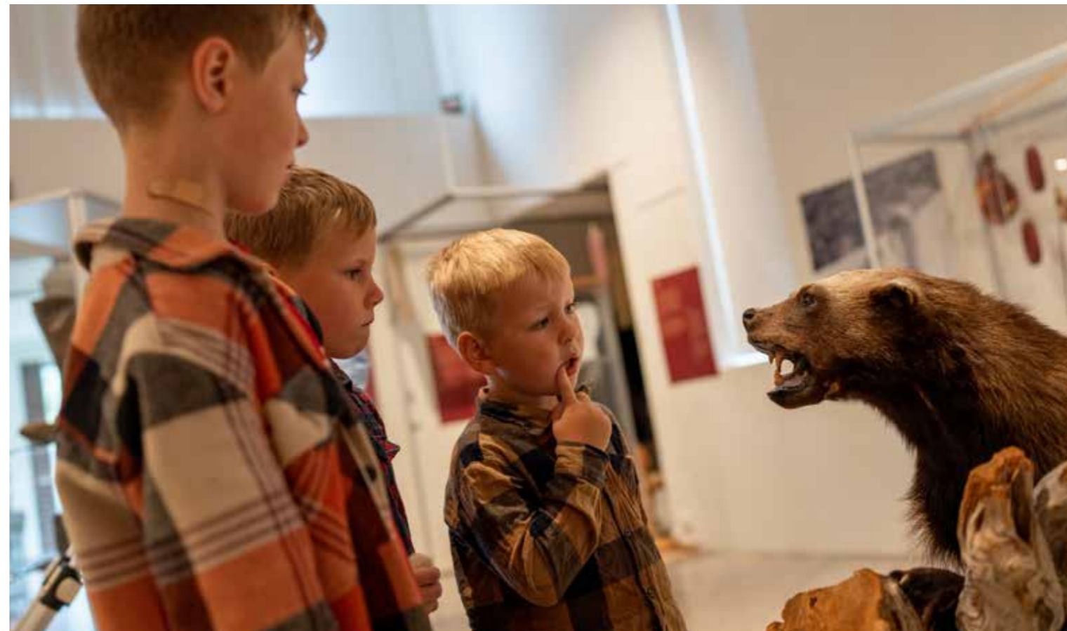
Den utstoppa jerven med tre føter i utstillinga «Dyrebar» gjer inntrykk.