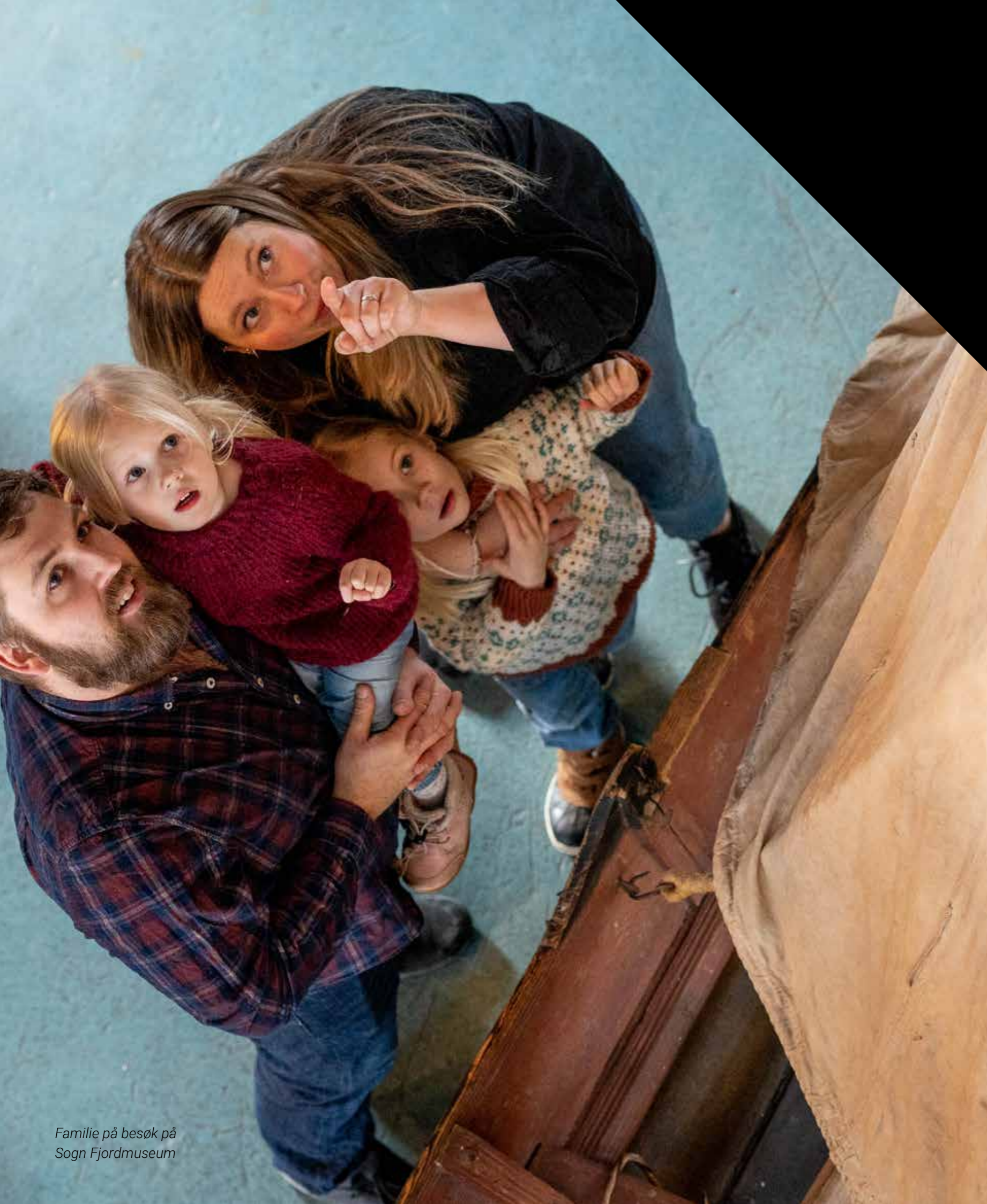
Familie på besøk på Sogn Fjordmuseum