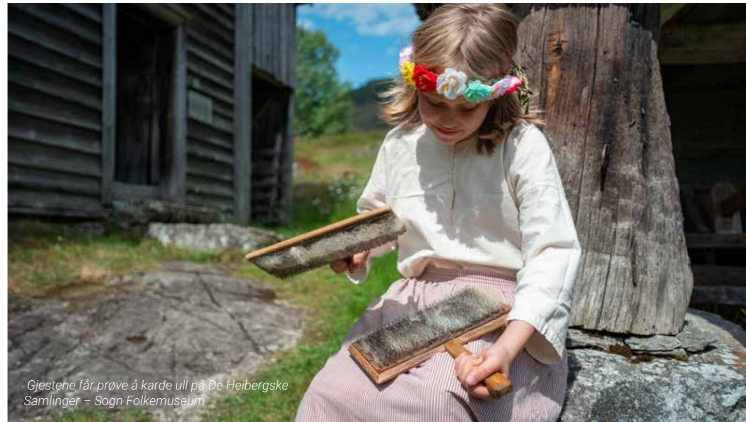
Gjestene får prøve å karde ull på De Heibergske Samlinger – Sogn Folkemuseum