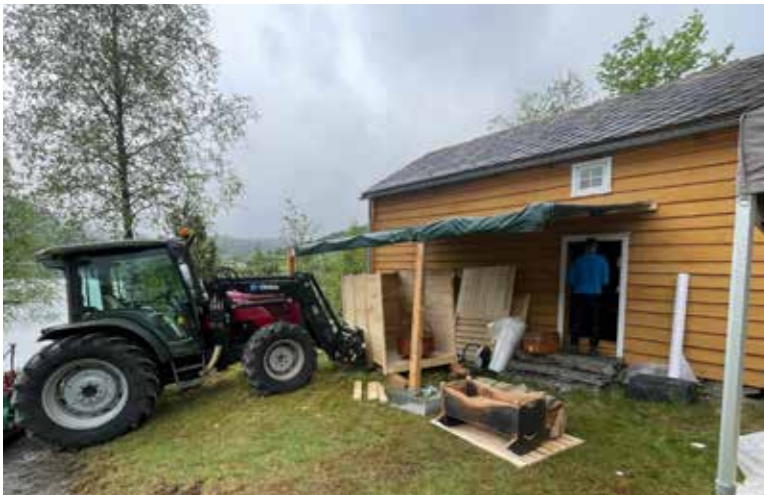
Gjenstandar flytta ut av Raudanaustet.