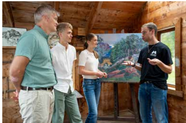
Sommarvert har omvising i Nikolai Astrup sitt atelier.

I kunstnarheimen på Sandalstrand var atelieret ferdig restaurert til sesongstart 25. mai. Astruptunet var inne i sitt siste år med rehabilitering av hage og bygg i 2023, og resultatet av prosjektet er markant. Terrassane som Astrup grov fram, er no synlege og tilbakeført slik kunstnaren sette preg på dei