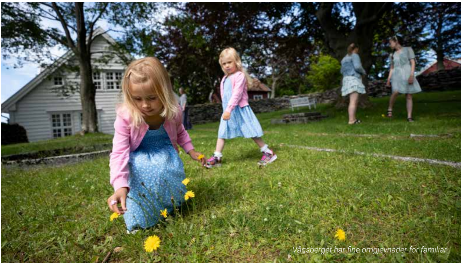
Vågsberget har fine omgjevnader for familiar.