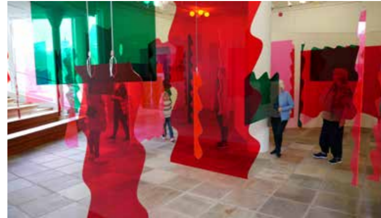
Opning av utstillinga Intervju – Siri Aurdal.

Før sommaren opna heile fire utstillingar. Først ut var Eikaasgalleriet, der eit av musea sine nyinnkjøpte kunstverk blei presentert for første gong. Siri Aurdal er kunstnaren bak verket, og den store installasjonen tok all plassen i hjartet av bygget. Saman med fleire av Ludvig Eikaas sine mest kjende verk, blei galleriet opna 2. juni.