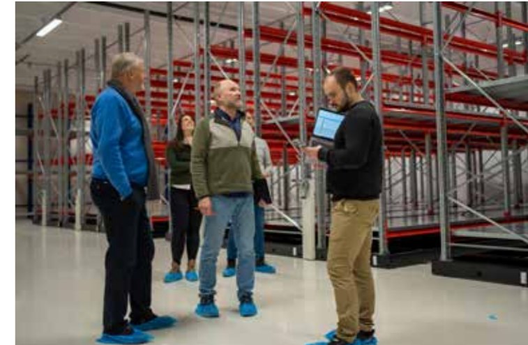
Overrekking av Tinghuset frå entreprenør Åsen & Øverlid.

For å sikre gode prosedyrar når Tinghuset blir teke i bruk, har vi valt ut ein avgrensa del av samlinga som skal nyttast som test for dei ulike fasane i ein