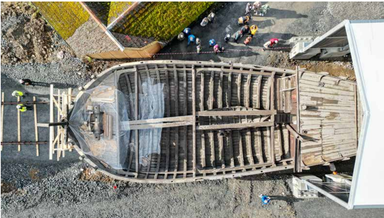
Holvikejekta vart dratt ut av sitt gamle naust og inn i ein midlertidig rubb-hall.