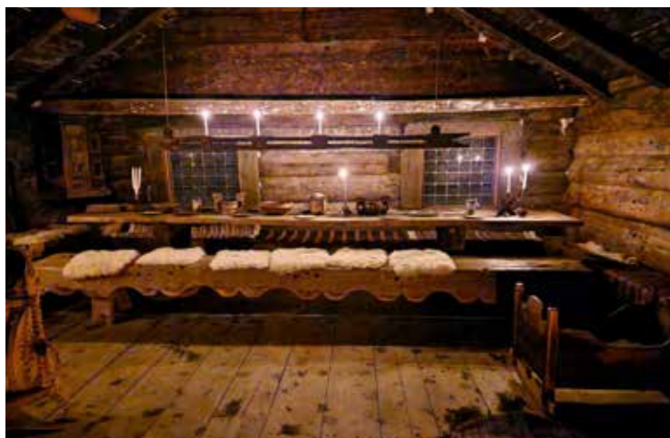
Jul i Stavedalsstova på De Heibergske Samlinger - Sogn Folkemuseum, frå om lag år 1600.

Jula står i ei særstilling på kulturhistoriske museum, og på alle tre folkemusea kunne vi invitere publikum inn i julepynta stover i friluftsmuseet. På Nordfjord Folkemuseum var det i tillegg ei miniatyrtstilling som formidla ulike juletradisjonar gjennom fleire hundreår – frå julestri til juletrepynt.