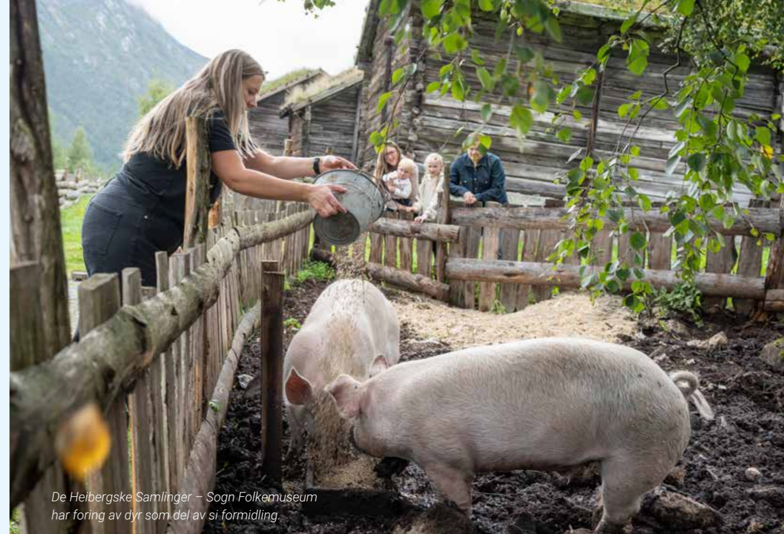
De Heibergske Samlinger – Sogn Folkemuseum har foring av dyr som del av si formidling.