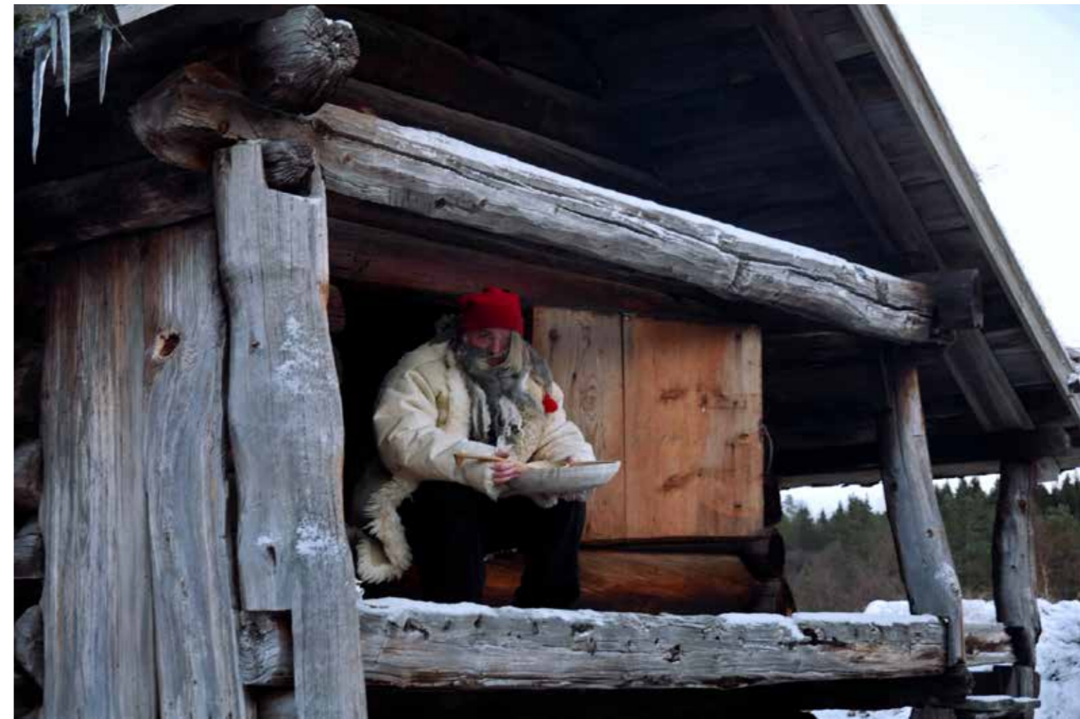
Eit populært tilbod på De Heibergske Samlinger er å gje nissen graut i adventstida.

Musea er vertskap for ei rekkje arrangement for ulike målgrupper gjennom året, både for eigne arrangement og som medarrangør eller samarbeidspartnar med eksterne aktørar. I tillegg til enkeltarrangement har fleire av musea arrangementsseriar med eigen programprofil som