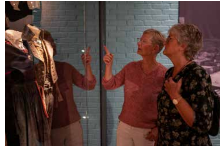
Utstillinga «Attåt» handlar om ulike yrker folk har hatt ved sidan av gardsarbeidet.

Sunnfjord Museum var vertskap for vandreutstillinga «Skakke folkedraktar – ikkje ei draktutstilling» i november, kuratert og produsert av Nasjonalmuseet. I utstillinga utforska og utfordrar seks samtidskunstnar draktskikkar, identitet og handverkstradisjonar. Kulturhistoria sine symbol og