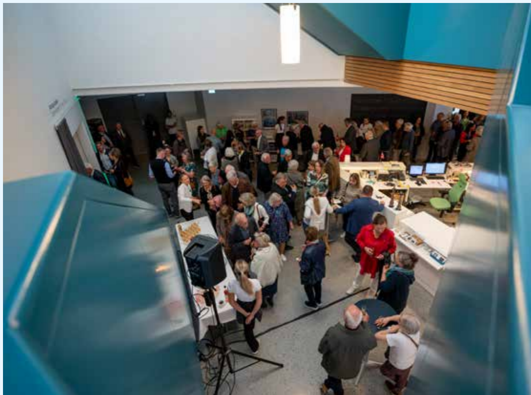
Mange møtte opp på opning av Astrup-utstillinga