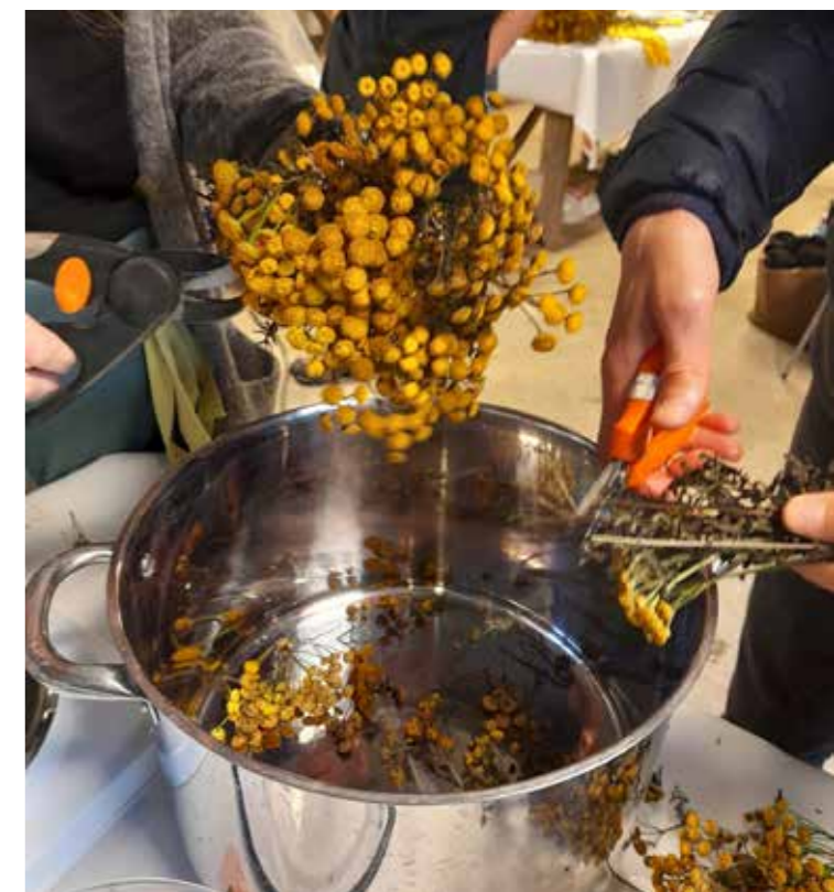
Frå kurs i Plantefarging på Sunnfjord Museum.

Kurstilbod er med på å gjere musea til ein attraktiv læringsarena, og vi har i 2023 tilbydd kurs i lefsebakst, ølbrygging og plantefarging. Gjennom kursa får deltakarane praktisk innføring i ulike handverksteknikkar og innsikt i immateriell kunnskap forvalta av tradisjonsberarar.