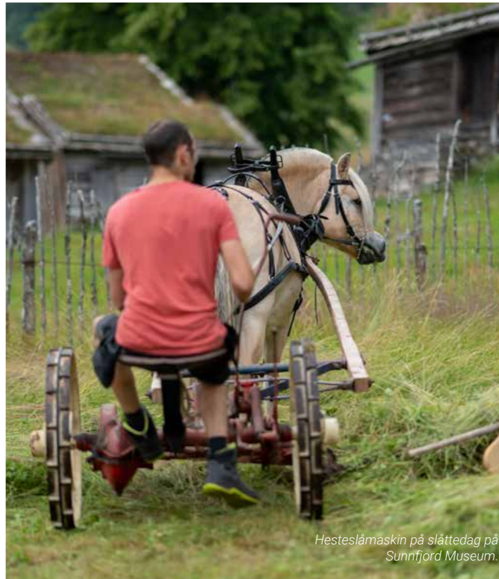
Hestelåmaskin på slåttedag på Sunnfjord Museum.